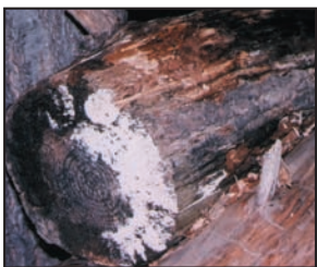
Moho creciendo sobre leña al exterior. Los mohos tienen varios colores, esta foto enseña ambos mohos blanco y negro.

Los mohos forman parte del medio ambiente natural. Al exterior, los mohos juegan un papel en la naturaleza al desintegrar materias orgánicas tales como las hojas que se han caído o los árboles muertos. No obstante, al interior, es necesario evitar el moho. Los mohos se reproducen mediante esporas; las esporas son invisibles a simple vista y flotan en el aire exterior e interior. Las esporas de mohos se hallan normalmente presentes en el aire exterior e interior. El moho puede crecer al interior cuando las esporas