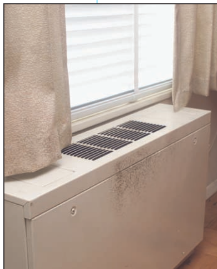
Moho creciendo sobre la superficie de un ventilador.

■ Cuando ocurran pérdidas o derrames de agua en el interior, ACTÚE RÁPIDAMENTE . Si se secan los materiales o las zonas mojadas o húmedas en las 24-48 horas que siguen una pérdida o derrame, no crecerá el moho en la mayoría de los casos.