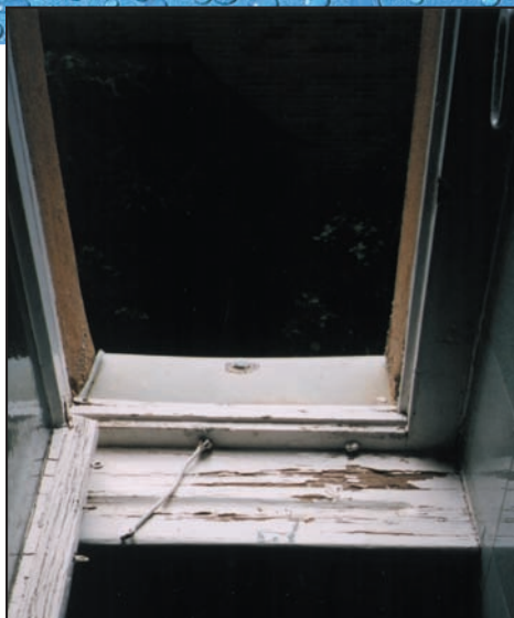
Ventana con fugas - el moho está empezando a crecer en el marco de madera y en el apoyo de la ventana.

Si ya tiene un problema con el moho — ACTÚE RÁPIDAMENTE.