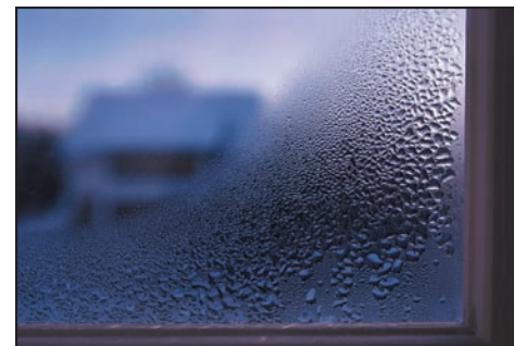
Condensación en el interior del vidrio de la ventana.