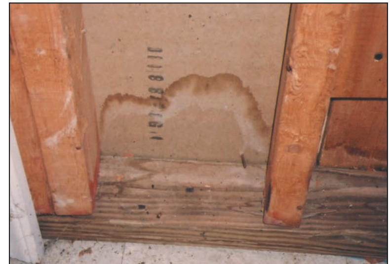
Mancha de agua en la pared de un sótano – ubicar y corregir prontamente la fuente del agua.

Se riega tome nota: El moho muerto puede seguir causando reacciones alérgicas en las personas, por lo tanto no es suficiente matar el moho, sino que también se debe eliminar.