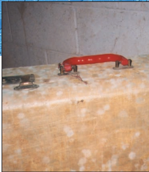
Moho creciendo en una maleta guardada en un sótano húmedo.

Es importante tomar precauciones que limiten su exposición al moho y a las esporas de moho.