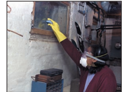
Persona limpiando con respirador N-95, guantes y gafas de protección.