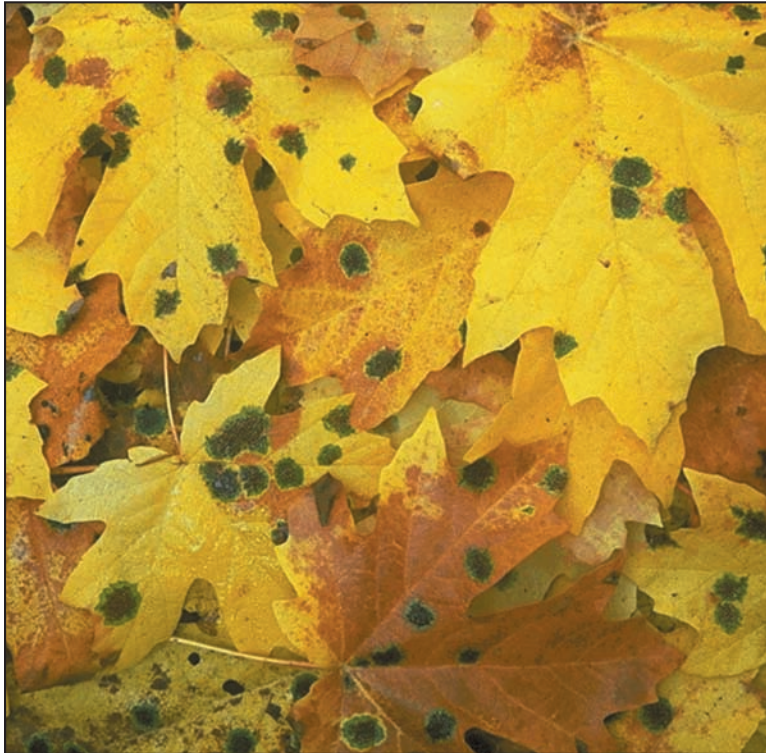
Moho creciendo en hojas caídas.

Se puede obtener este documento del sitio Web de la División para Medio Ambientes Interiores, EPA en www.epa.gov/mold