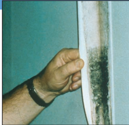
Moho creciendo detrás de un empapelado.

Sospecha de moho escondido Puede sospechar que existe moho escondido si un edificio huele a moho, pero que no puede ver su origen o si sabe que hubo daños causados por el agua y que los residentes se quejan de problemas de salud. El moho puede esconderse en lugares tales como la parte trasera de las planchas de yeso o drywall, empapelado, revestimientos de madera, la parte superior de baldosas de techo, la parte inferior de moquetas y tapices, etc. Las ubicaciones posibles del moho escondido incluyen zonas dentro de paredes alrededor de tuberías (con tuberías con pérdidas o condensación), la superficie de paredes detrás de muebles (en las que se forma condensación), en los conductos interiores, y en los materiales de techados encima de las baldosas de techos (debido a goteras en el techo o aislamiento insuficiente).